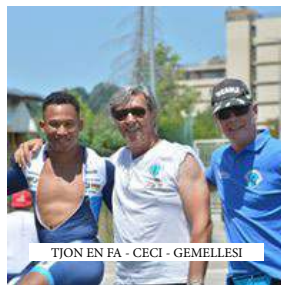
TJON EN FA - CECI - GEMELLESI