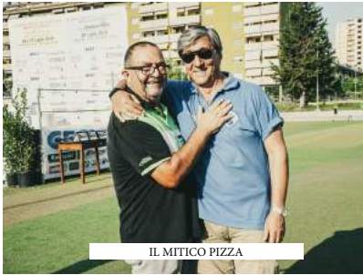
IL MITICO PIZZA