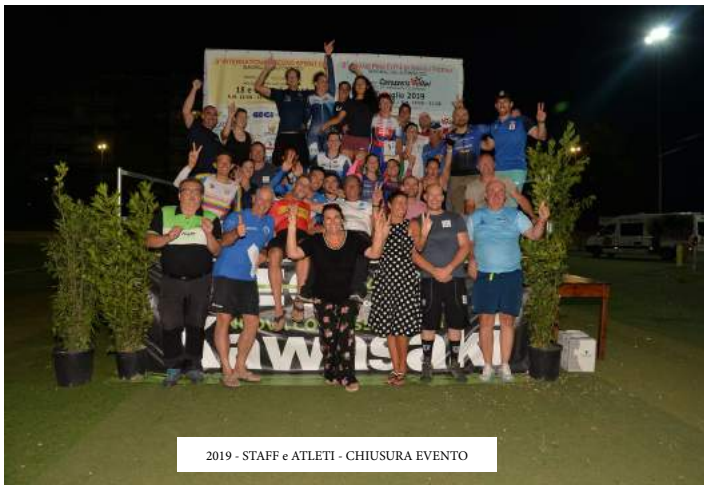
2019 - STAFF e ATLETI - CHIUSURA EVENTO