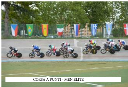
CORSA A PUNTI - MEN ELITE

Team CECI DREAMBIKE - Centro Pista Ascoli -