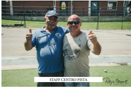
STAFF CENTRO PISTA