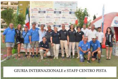
GIURIA INTERNAZIONALE e STAFF CENTRO PISTA