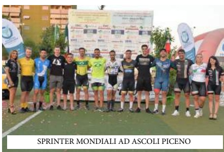
SPRINTER MONDIALI AD ASCOLI PICENO