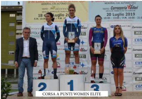
CORSA A PUNTI WOMEN ELITE