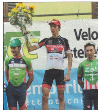
Il podio del 2018.