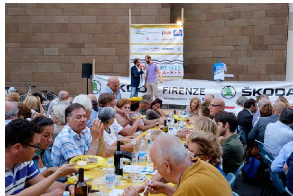
Nella foto: la cena di presentazione della 69a Firenze-Mare (09/07/2015)