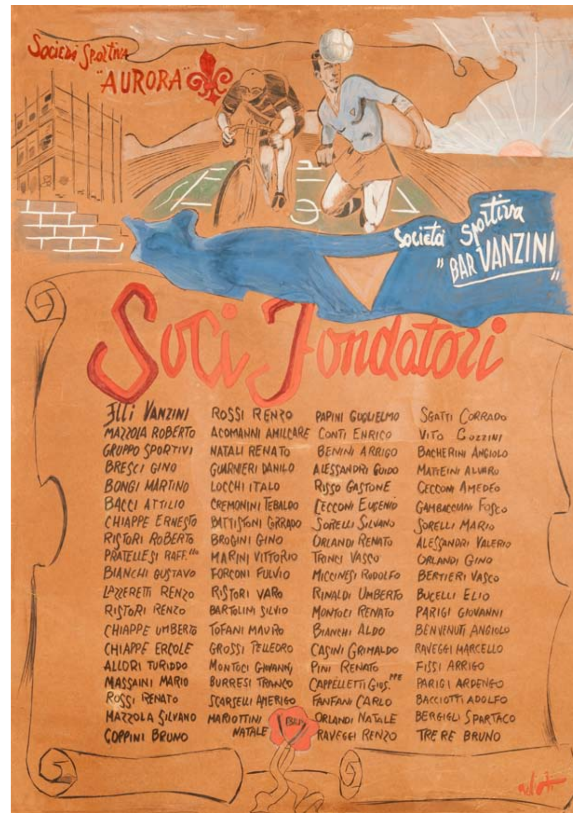
Immagine: i mitici soci fondatori dell'Aurora