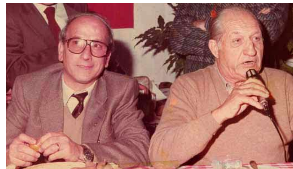
Nella foto: il grande Gino Bartali. Sempre presente alle presentazioni della Firenze-Mare